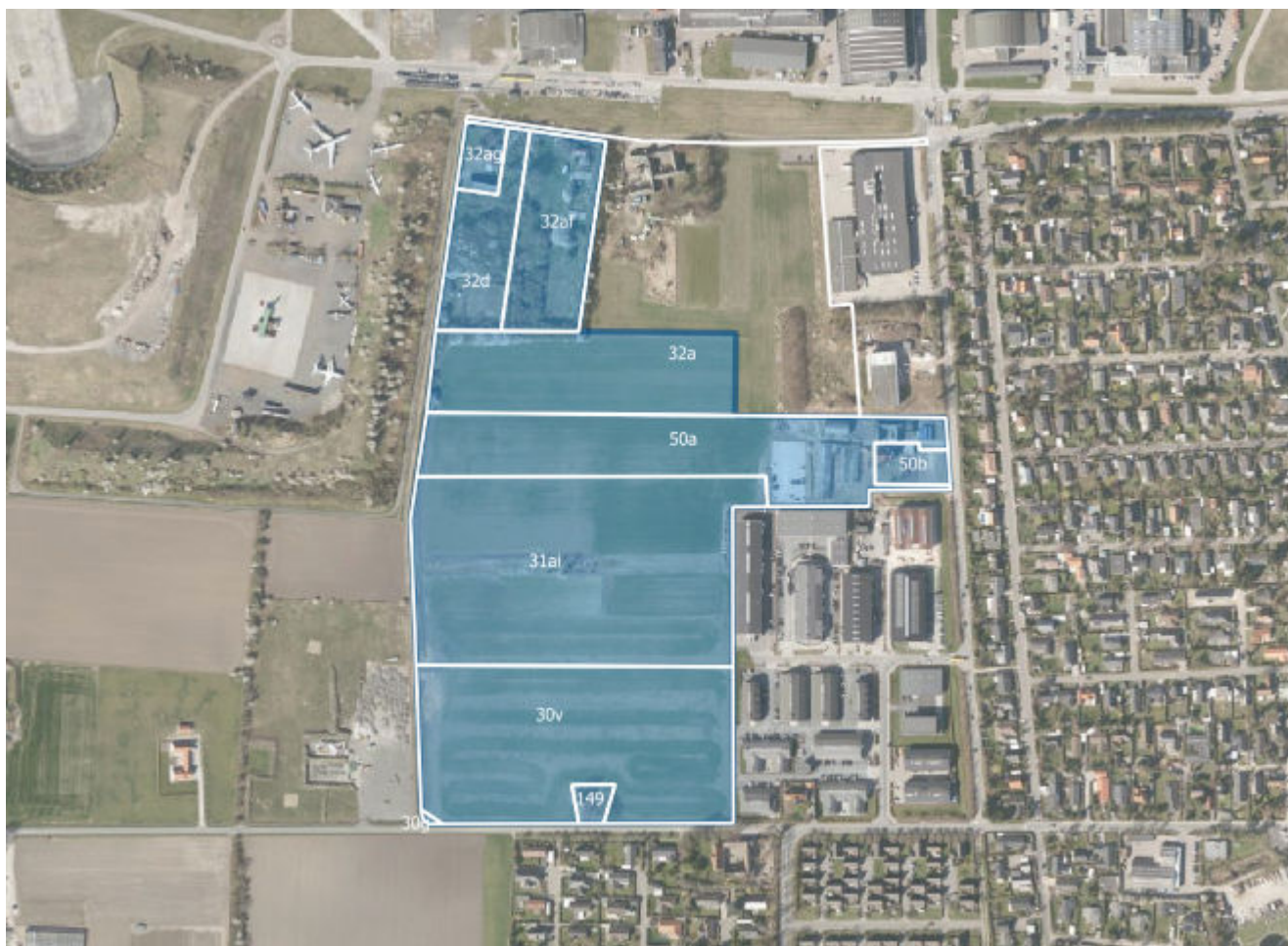
Arealet der udlægges i Dragør Kommune syd for lufthavnen (ved A. P. Møllers Allé)