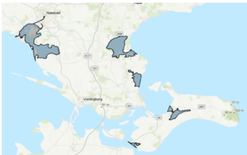
Kortskitse over områder, hvor fiskeri med nedgarn ikke er tilladt (grå områder).