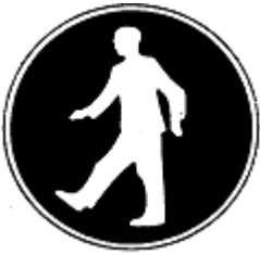
Generelt påbud (i givet fald med supplerende skilt)