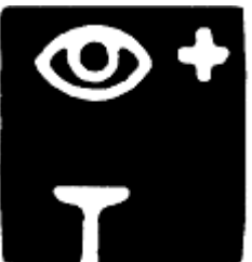
Telefon til redningsvæsen og førstehjælp