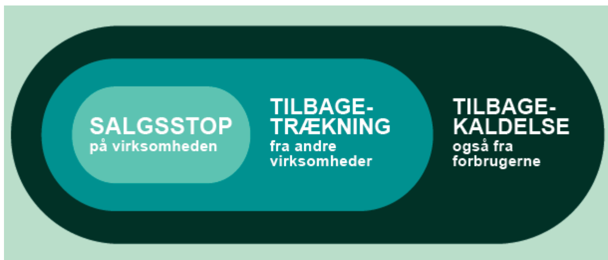
Skematisk oversigt over, hvornår virksomheden skal starte en tilbagetrækning eller en tilbagekaldelse.